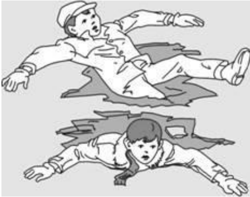
Попытки вылезти самому из полыньи грудью или спиной

Если вы провалились под лед, широко раскиньте руки, навалитесь грудью или спиной на лед и постарайтесь вылезти на него самостоятельно, зовите на помощь.