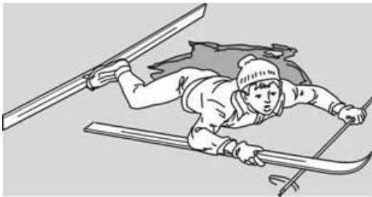
Попытки вылезти самому из полыньи с лыжами

Провалившемуся необходимо внушить, чтобы он широко раскинул руки на льду и ждал помощи, так как самостоятельная попытка вылезти из воды может привести к новому обламыванию кромки льда и очередному погружению пострадавшего под лед.